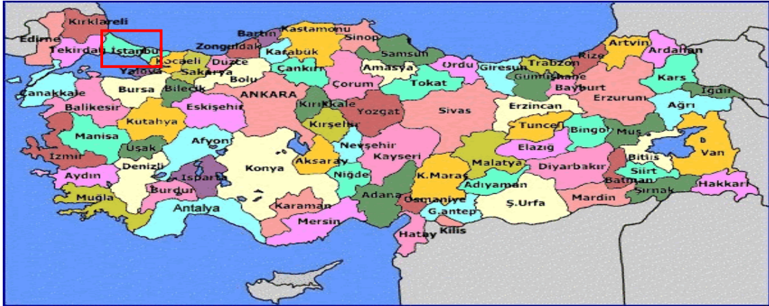
Harita 1 - İstanbul'un Konumu

İstanbul, Türkiye'nin en büyük kenti olup, 15 milyon kişiyi aşan nüfusu ile dünyanın da sayılı kentlerinden biri haline gelmiştir. Batı ile Doğu arasında köprü olma özelliği ile yerli ve yabancı sermaye için, bölgelerarası ilişki kurma ve bölgelere açılma yönünden önemli bir merkezdir. İstanbul Boğazı, Karadeniz'i, Marmara Denizi'yle birleştirirken; Asya Kıtası'yla Avrupa Kıtası'nı birbirinden ayırmakta ve İstanbul kentini de ikiye bölmektedir.