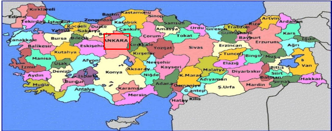
Harita 1 - Ankara'nın Konumu

Ankara, başkent olmadan önce otuz bin kişilik bir nüfusa sahipti; ancak başkent olduktan sonra önce İstanbul ve İzmir'den sonra en kalabalık üçüncü kent oldu, ardından İzmir'i geçerek İstanbul'dan sonra Türkiye'nin en kalabalık kenti oldu. Ankara bugün dünyanın en kalabalık 38. kentidir. Kent nüfusu bugün beş milyon civarında olmakla birlikte her geçen gün büyümektedir. Kent, ülkenin en çok göç alan kentlerindedir.