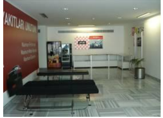
Zemin kat giriş holü