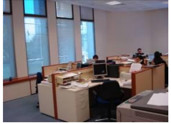
İş Bankası Maslak Şubesi