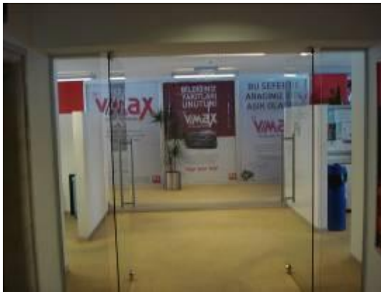
Ofis katları hol