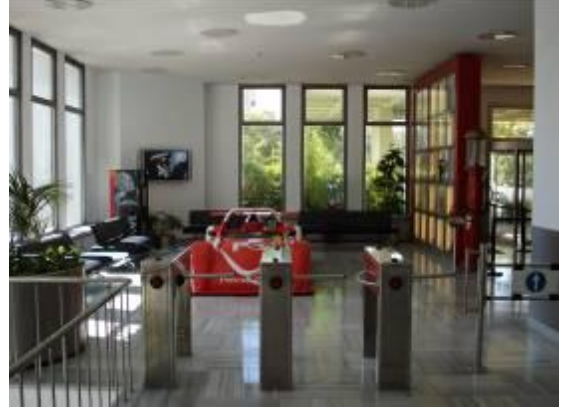
Zemin kat giriş holü