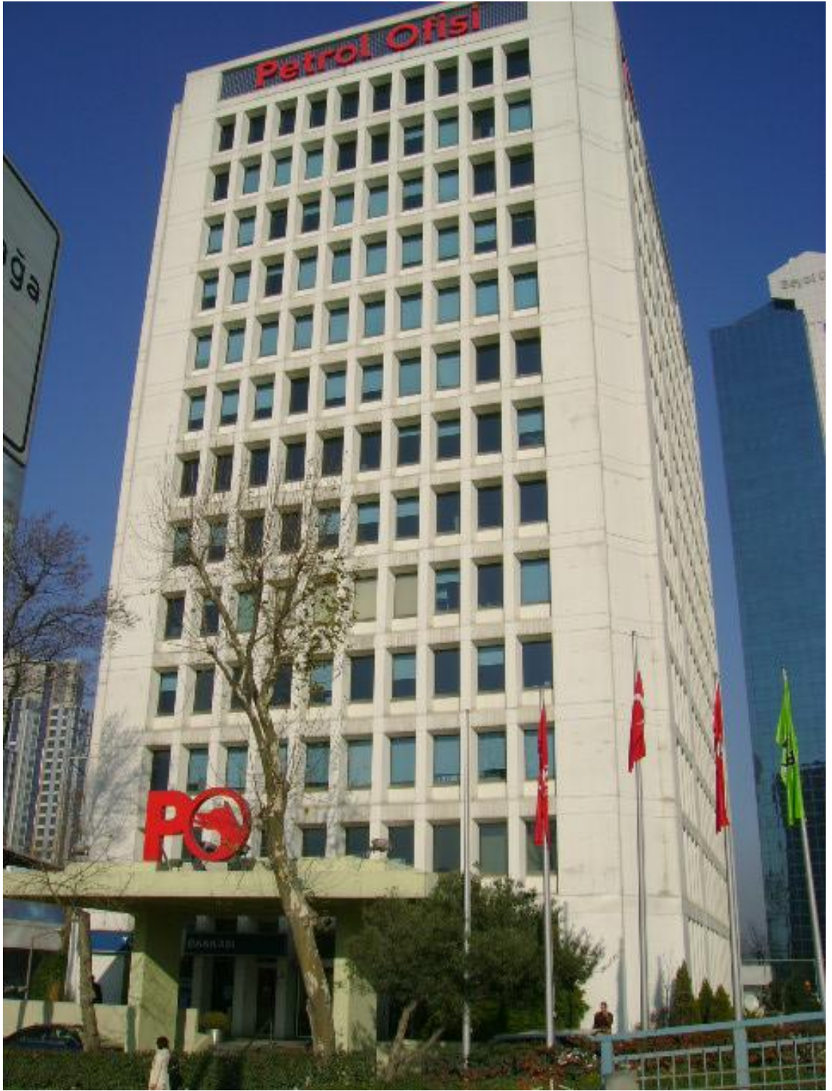
Binanın görünüşü